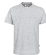
024 ash meliert