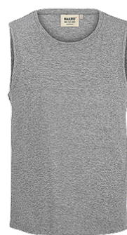
015 grau meliert