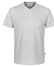
024 ash meliert