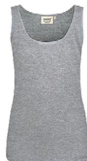
015 grau meliert